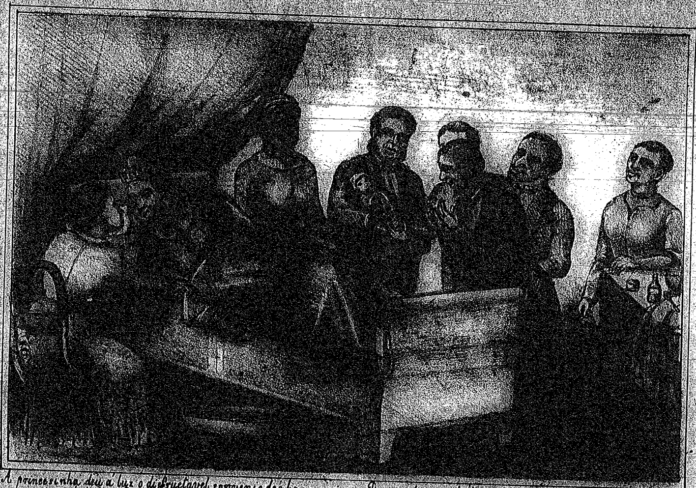
A presença deu a luz o destrutível convenio dos barraqueiros. Bom sera que o niño que nasceu tão robusto, não venha a morrer de inanição.